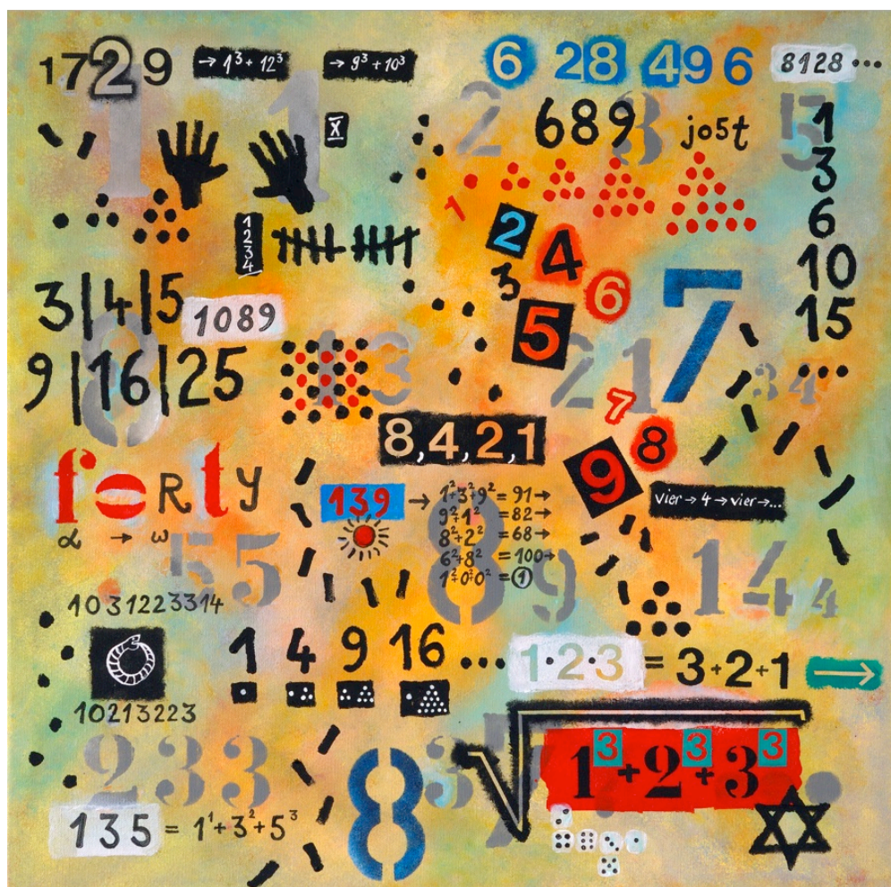
Mit Zahlen gespielt. Acryl auf Leinwand, 60 x 60 cm